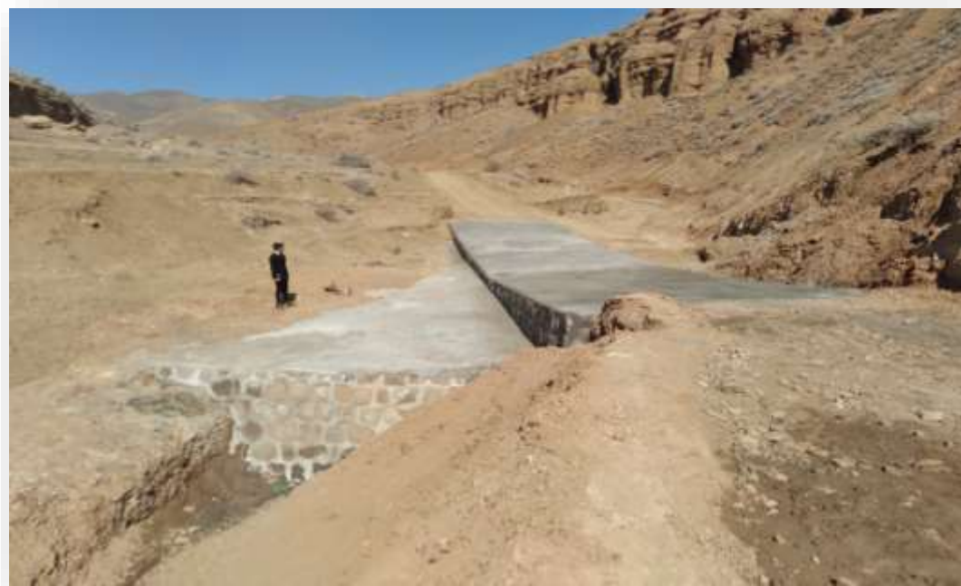
نمونه هایی از صورت وضعیت های پروژه های عمرانی: